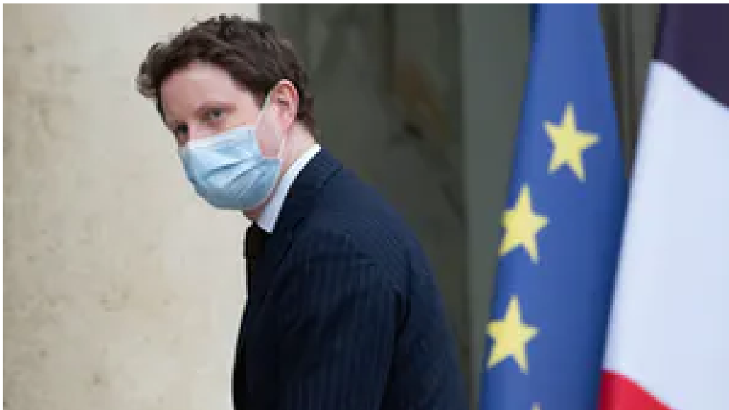
Fransen staatssecretaris Beaune: 'Met die zuinigheid zijn jullie ver gekomen'